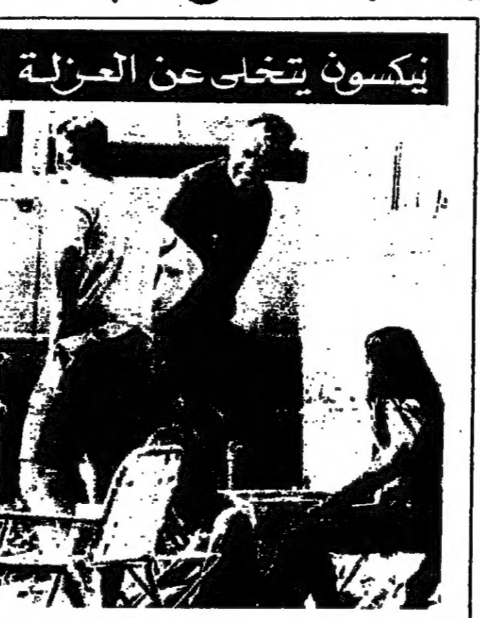
نيكسون يتخلى عن العزلة

قلت صحيفة « التايمز » اللندنية امس، ان احتمال اغتيال الرئيس جيهان عبد الناصر خلال ازمة السويس عام ١٩٥٦ كان فكرة راودت الفكري اتوني ايدن رئيس الوزارة البريطانية آنذاك. ونسبت الصحيفة في رسالة لها من واشنطن الى اميلز كويلاهد احد كبار المسؤولين في وكالة الاستخبارات المركزية امريكية سابقا قوله قسي اتصال هاتفي معه، انه بحث مع مرة، ولكن في غير جيبية، في المسئلة مع السير اتوني وغيره من كبار المسؤولين في الوكالة. وقالت الصحيفة ان رئيس الوزراء المحافظ السابق ( اللورد اتون الان ) وصف هذا الزعم بأنه « مضمومة زهت » اذ انه لم يبعث ابدا في بحفلة اغتيال اي انسان. وقالت « التايمز » ان كويلاهد قل انه اطلع الحقلين في لجنة الاختبار التي نظرت في نشاط وكالة الاستخبارات المركزية، على اهتمام اللورد اتون الكبر بعملية الاغتيال، كمال يظهر ان كل امره تحدث عن مثل هذه الامور. ونسبت الى كويلاهد قوله: ان اتوني ايدن اراد اني ان اتصل عبد الناصر. وقال كويلاهد ان بين الوسائل التي تناولها البحث قتل عبد القاهر، فس الاسم له في تجان قوة. لندن - ر